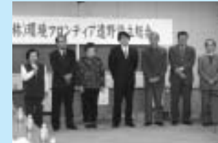
16年11月に開催された設立総会

【年会費】 個人会員2000円、団体会員5000円 申込み・問合せ先=市環境課生活衛生係 (☎@2111内線321) で随時受付しています。