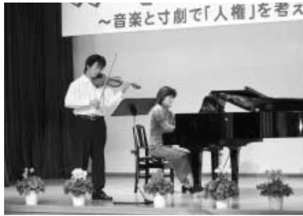
息の合った演奏で参加者を魅了したミニコンサート