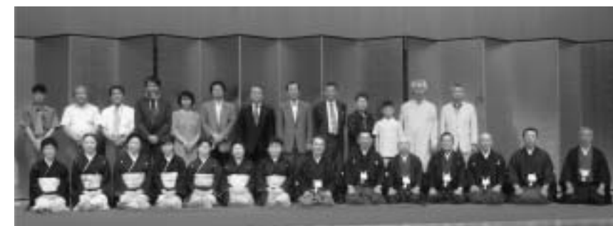
「東京の夏音楽祭2005」に出演した氷口御祝保存会の皆さん

県内のほかの地域には伝承されていない特有の芸能として高く評価され、無形民俗文化財に指定して長く保存継承することが望ましいことから今回の指定となりました。氷口御祝保存会は、平成三年に国立劇場で開かれた「アジア太平洋うたとおどりの祭典」へ