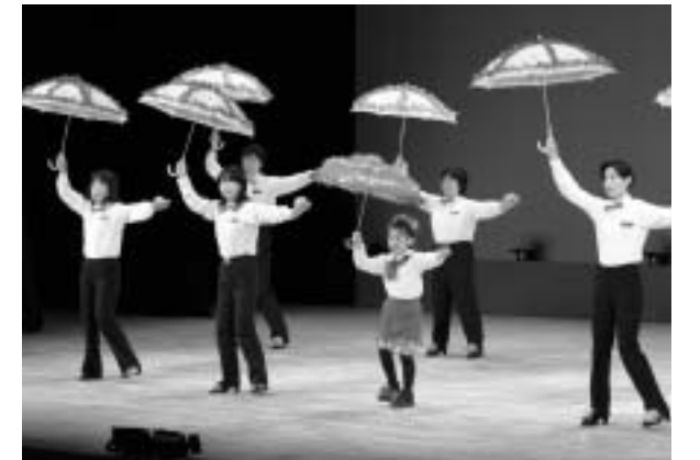
軽快な音楽に合わせて東京ブギウギを披露する附馬牛町婦協6区の皆さん