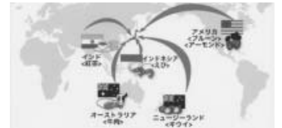
「我が家の環境大臣 (http://www.eco-family.jp/)」から引用