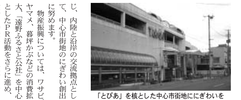
「とびあ」を核とした中心市街地にぎわいを

未来に残すため、森林組合と共同歩調を取りながら、間伐などによる森林整備を推進します。 木材振興については、遠野型住宅の魅力を広げPRし、首都圏方面への遠野産材の需要拡大を推進していくとともに、公共建築物木造化の採用促進に向けた研究事業に取り組みます。 商工業の振興については、遠野市総合産業振興センターを核に、関係機関との横断的な連携により、市民が「おもしろさ」と「やる気」を感じる産業の創出を積極的に進めます。市内におけるコミュニティビジネスなどの起業の新たな掘り起こしや既存企業の経営革新の取り組みを促すとともに、遠野地域ビジネス支援専門委員会を中心に、ビジネスプランへの助言と遠野ふるさと再生基金による資金支援を行い、地域内発型による産業振興に努めます。 企業誘致については、遠野に適した企業の誘致を推進し、安定的な雇用の場の確保と若者の定住につながるよう努めます。 商業の振興については、商工会など関係団体と連携を図りながら商店街の活性化に努めます。また、中心市街地活性化基本計画およびTMOの再構築、中心市街地の核施設である「とびあ」にぎわいをもたらす戦略を講