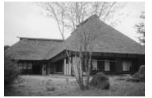
旧菊池サイ家(現「弥十郎どん」)

国の文化財保護審議会は十一月十八日、遠野ふるさと村にある茅葺屋根の建物二棟を国の登録有形文化財に指定するよう文部科学大臣に答申しました。文化財登録制度は古きよき建造物を活用しながら保存するために作られた国の新しい制度です。従来の文化財指定制度に比べ、考え方や諸規制がゆるやかになっていきます。登録の対象となるのは、建築後五十年を経過した建造物で、広く親し