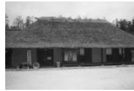
旧菊池喜右工門家(現「こびるの家」)

国の文化財保護審議会は十一月十八日、遠野ふるさと村にある茅葺屋根の建物二棟を国の登録有形文化財に指定するよう文部科学大臣に答申しました。文化財登録制度は古きよき建造物を活用しながら保存するために作られた国の新しい制度です。従来の文化財指定制度に比べ、考え方や諸規制がゆるやかになっていきます。登録の対象となるのは、建築後五十年を経過した建造物で、広く親し