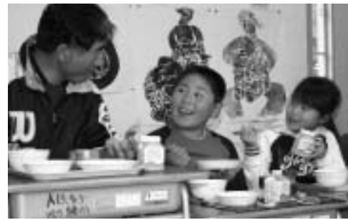
地元産農産物による「食育」を推進

「ぬくもり」と「もてなし」の心で創る都市住民との交流促進「おもしろさ」と「やる気」を感じる元気ある産業振興、「やさしさ」と「温かさ」が通じ合う保健、医療、福祉の充実と捉え、果敢に取り組みを進めます。 市民の声にしっかりと耳を傾け、遠野らしさを前面に押し出した施策の展開によって、地域の活性化を図り、合併して良かったと市民の皆さまが実感でき、次代を担う子どもたちが自信と誇りと愛着の持てる存在感のあるまちづくりを目指して、新「遠野市」の初代市長として、全身全霊をかけて市政運営に当たります。