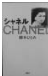
「シャネル」 藤本ひとみ 著