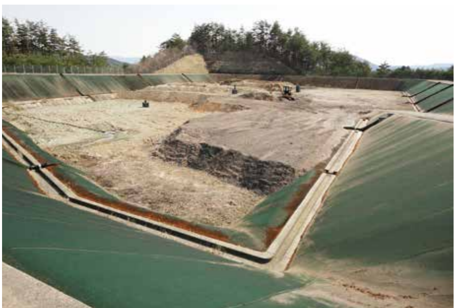
宮守町下宮守にある遠野市一般廃棄物最終処分場

◆どちらが正解といつた レベルの問題ではな い。有料といっても徴 収したお金は結局住民 サービスに使われ、無 料の場合も負担軽減の 意味から住民サービス となっている。一番の 目的は、ごみの量を減 らしたり分別の徹底化 を促進して、環境に配 慮することではないだ ろうか。