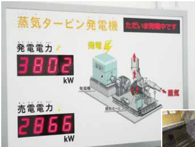
クリーンセンター内の蒸気タービン発電機