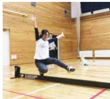
スラックラインは楽しみながら体幹も鍛えられる

※スラックライン：ペルト状の幅5cmの専用のラインを綱渡りのように使用して、遊びながらバランス感覚や集中力を鍛えるエクササイズ。