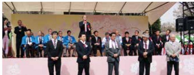
武蔵野桜まつりの様子

◆武蔵野桜まつり 市民のふるさとづく りや友好都市との交流 を目的に毎年開催さ れ、今年で24回目を数 える。まつりの式典で 当市議員の紹介を行 い、友好都市歓迎昼食 会では、武蔵野市議 議員との交流を図るこ とができた。今後も交 流を深めていきたい。