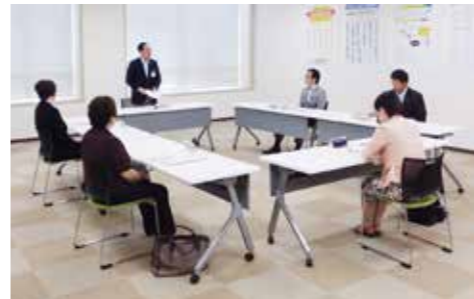
総合教育会議は、市長と教育委員会が教育行政の方向性を共有し、一致して執行にあたるための協議や調整を行う「場」。一般傍聴が可能です。