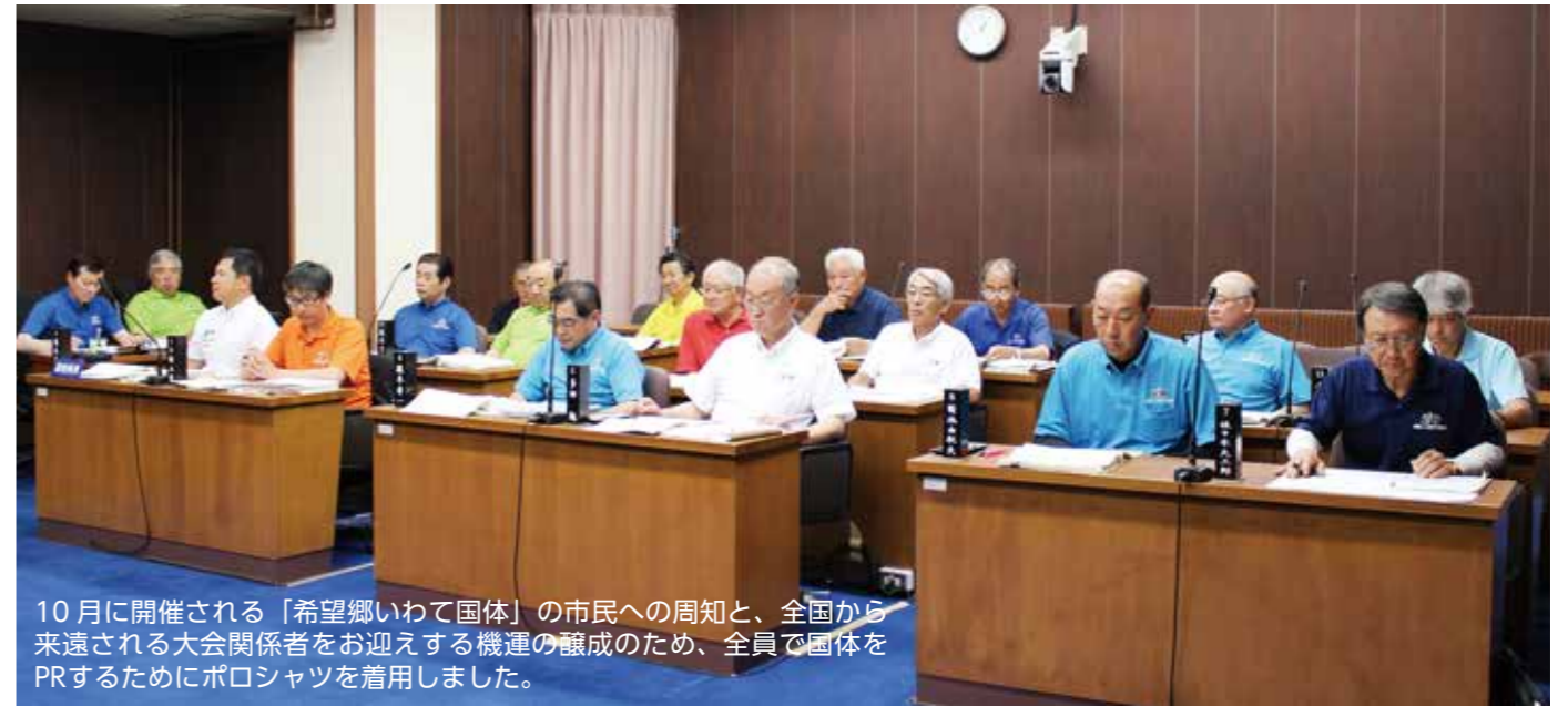
10月に開催される「希望郷いわて国体」の市民への周知と、全国から来遠される大会関係者をお迎えする機運の醸成のため、全員で国体をPRするためにポロシャツを着用しました。