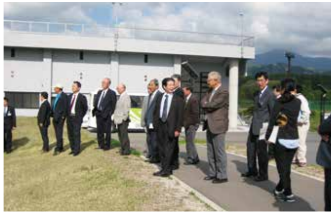
遠野運動公園では10月2日から6日まで競技が催される