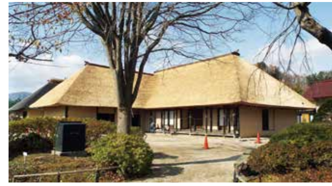
伝承園にある菊池家住宅のかやぶき屋根

問 伝統かやぶき屋根再生事業費について 答 事業の内訳は、平成19年度に「かやぶき屋根再生事業方針」を定め平成27年度まで順次、葺き替え作業を実施してきた。平成28年度から5か年の新たな方針を策定し、今年度は遠野ふるさと村弥十郎どん屋根葺き替え工事請負費として6千万円の事業費を計上した。 問 今年度から新たに5か年計画のようであるが、5年間どのくらいの屋根の葺き替えをやるのか。 答 平成29年度から32年度までで6か所の計画で、1億8300万円の予算である。 問 原料となる「かや」は