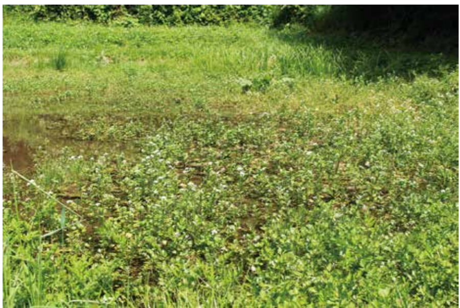
宮守町湯屋地区で栽培されているクレソン

また、農業振興課、六次産業推進本部等、総合力を生かして新規農業の参入に果敢に挑戦したい。