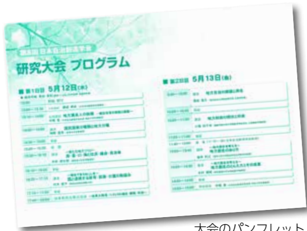
大会のパンフレット