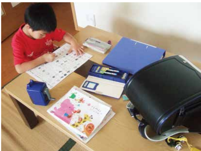
速やかな就学援助を期待する

慎重に検討する。また、「新入学児童生徒学用品費」の支給が7月となっていることについても、速やかに支給できよう検討する。