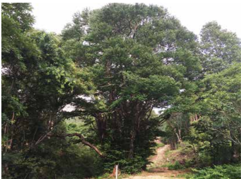
遠野市指定天然記念物の1つ千本カツラ

今後も未指定の文化財を含めて様々な調査・保存・継承に取り組み、情報発信や環境整備に努め、文化の向上と郷土愛の醸成に役立てながら、文化財を生かした活力ある地域づくりを推進していく。