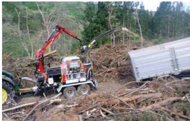
林地残材のチップ化作業の様子