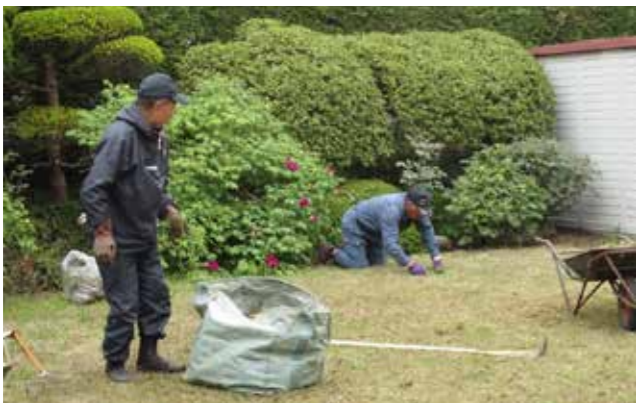
高齢者の働き方を応援する取り組みの推進を.....