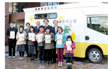
新しい移動図書館車の前にっこり

図書を通じ、東日本大震災の復興支援活動に取り組む(公社)シャンティ国際ボランティア会は、子どもたちの読書活動に役立ててほしいと、移動図書館車を本市に寄贈しました。