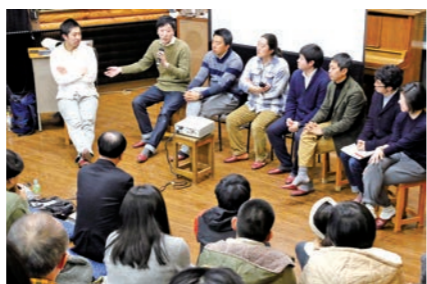
たくさんのアイデアが出されました

市内外の人が集い、遠野の魅力を生かした地域づくりを考える「ローカル・ハック・デイズ」(パラミタ主催)は、遠野みらい創りカレッジを拠点に2日間の日程で開かれました。