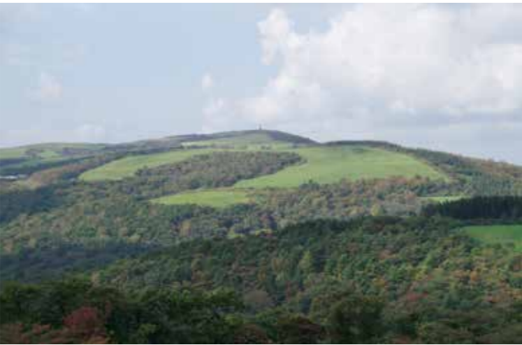
寺沢牧場の美しい景観

計画されている、発電用パネルの設置面積は約1000ha、内農地面積は600ha程度と聞いており、これだけの規模の農地法申請は、国内には例がない案件とされている。主に牧場で公共牧場も含まれ、第一種農地であり原則転用は許可できないことになっており、農地転用申請があった場合には、市当局は勿論のこと、岩手県や岩手県農業会議、当然国からの指導を仰ぎ、判断しなければない案件と考慮している。