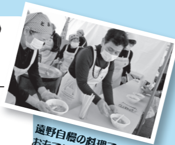
遠野自慢の料理でおもてなし!!