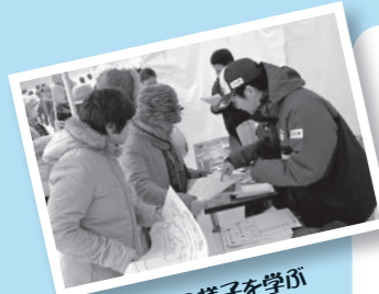
おもてなしの様子を学ぶボランティアの皆さん

ンティアの皆さんは、熱戦が繰り広げられる試合や、工夫を凝らしたおもてなし会場を見学。国体で本市を訪れる人の記憶に残る「遠野らしいおもてなし」に向けて思いを巡らせていました。