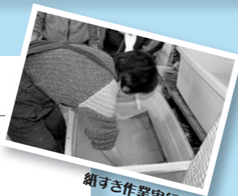
紙すき作業実行中!

市では、全国から訪れる選手団に贈る遠野ならではの記念品として「ホップ和紙のしおり」を準備しています。製作は、遠野緑峰高校の指導のもと、遠野ホップ和紙を育てる会の皆さんを中心に進められています。現在は、ホップ和紙の原料の「つるの皮」から繊維を取り出し、紙すきの作業を実行中。作業の様子は市実行委員会のホームページなどで見ることができます。