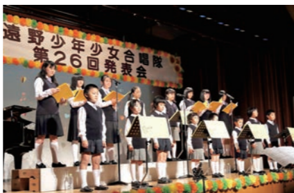
美しい歌声を披露する隊員

同発表会があえりあ遠野中ホールで開催され、5歳から中学生までの17人の隊員が童謡やわらべうた、アニメソングなど30曲を発表。訪れた100人は、その澄み切った美しい歌声とハーモニを堪能しました。また、ダンスを交えた発表も行われ、隊員らの元気な歌声に、会場からは大きな拍手が送られました。