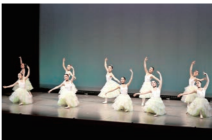
華やかな衣装を身にまとい、息の合った踊りを披露