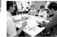
グループワークを通じて 本庁舎の未来を考えました→