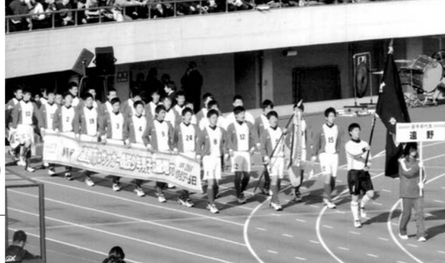
堂々と行進する遠野高校サッカー部