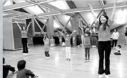
ブルズダンサーズによる チアダンス体験