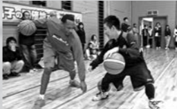
岩手ビックブルズによる バスケットボール教室