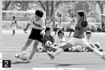
2_参加者は思いっきりプレー