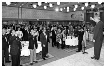
発売開始を祝い乾杯する関係者

10月4日、高級食材として注目されている宮守産根ワサビの魅力をもっとPRするワークショップを、神戸市で開催してきました。都会に暮らす若者を中心に23人が参加。採れたてのワサビを解体し、実際に擦りおろすまでの過程を紹介しました。参加者のワサビに対するイメージは、ほとんどがチューブに入った「練りワサビ」。本物のワサビを見て試食し、参加者はその香り高い味わいに驚いた様子で、「ワサビはベランダで育てられますか?」といった新鮮な反応もありました。宮守産のワサビを若い世代に知ってもらい機会として、今後も開催していきたいです。