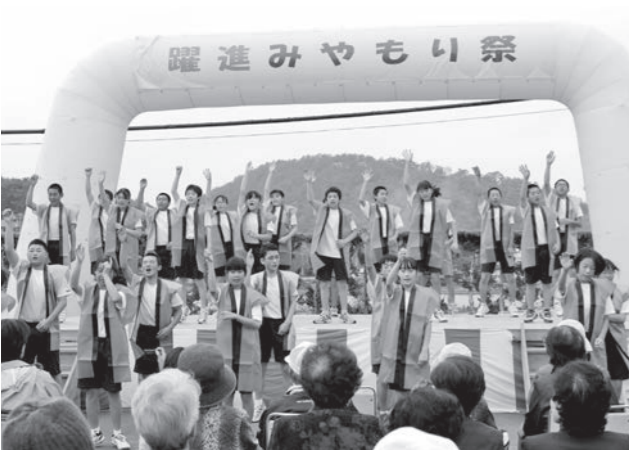
遠野西中のよさこいソーランが会場を盛り上げました