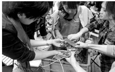
ワサビの解体に挑戦する参加者