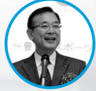
Jリーグチェアマン 村井 満 氏