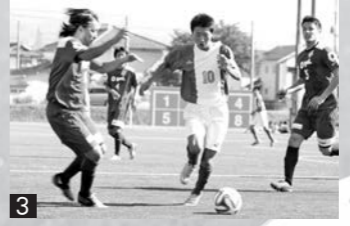
1_元日本代表の安永聡太郎さんらによるサッカー教室