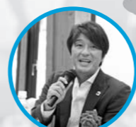
元サッカー日本代表 三浦 淳寛 氏