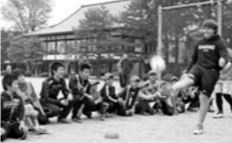
釜石シーウェイブスによる タグラグビー体験