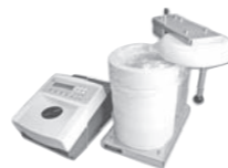
放射性物質濃度測定器