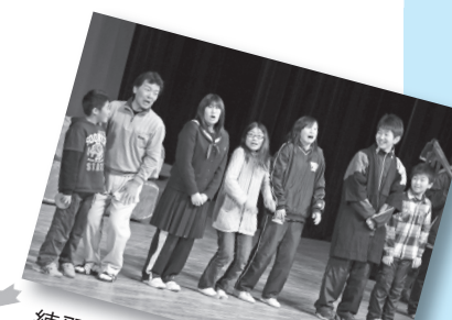
練習に励むキャストの皆さん