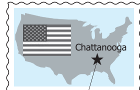
テネシー州チャタヌーガ市