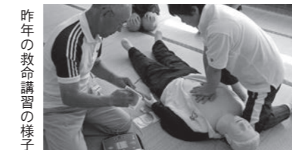
昨年の救命講習の様子