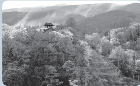
平成24年度最優秀作品「霧と花」