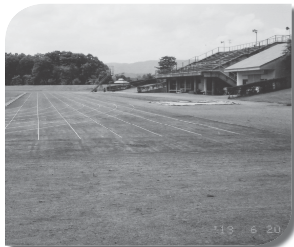
全天候舗装整備が望まれる市陸上競技場トラック

問 …………… 市職員の採用のあり方については、今まで長い期間、初級試験のみの実施だが、高学歴社会の時代にある時、「上級」試験等の導入を図るべきではないか。