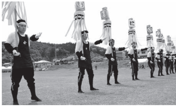
13年ぶりにまとい振りを披露する10分団員

遠野市消防演習は5月26日、早瀬川緑地公園などで行われました。参加した団員、婦人消防協力隊員ら630人は、各種訓練を通じて消防技術を再確認しました。 団員と車両62台は穀町を分行進し、緑地公園では消火や放水訓練、ラッパ隊によるドリル演奏などを実施。また10分団(宮守町達曾部)は「まとい振り」を13年ぶりに披露