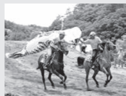
右・左/人馬一体で坂を駆け上がる姿に、会場からは盛んな拍手が送られました 上/会場を沸かせたアトラクション