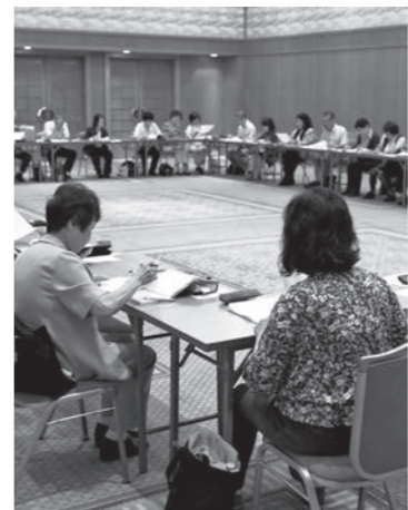
静けさの中、真剣に選句する参加者

勉強会は同会が毎年遠征先で開催しているもので、今年は本市で実施。関東や関西地方などから訪れた参加者は早池峰神社や重湊溪、伝承園など遠野の名所を訪れ、イメージを湧かせて3日間で30句を作りました。あえりあ遠野では3時間を掛けて句会を行い、渾身の一句を選んでいました。