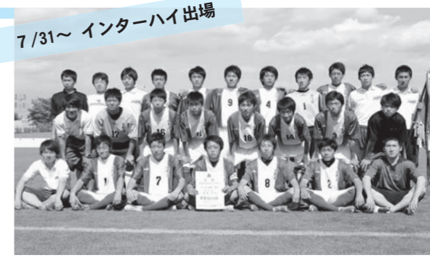
7/31～インターハイ出場

スピードのある攻撃を武器に、他を寄せ付けない強さで頂点に登り詰めました。本間主将は「サポートしてくれる皆さんへの感謝を忘れず、岩手の代表として全力で戦います」と全国での活躍を誓いました。