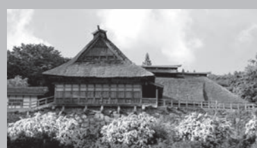
公有化された千葉家住宅

6月7~14日に開催された市議会6月定例会で、国重要文化財「千葉家住宅」が公有化されることが可決されました。7月6日から開館業務を(社)遠野ふるさと公社が行い、これまで通り見学することができます。今後は各種修理工事に向けた準備を進めていきます。