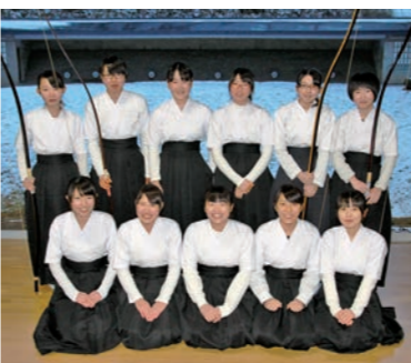
遠野高校女子弓道部