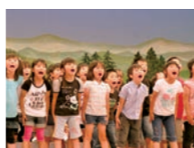
遠野小児童による「遠野の里の物語」

遠野小は歌・踊り・演技で遠野物語の世界を表現する「遠野の里の物語」を、昭和57年から30年間継続して取り組んできました。平成21年には『遠野物語』発刊100周年関連イベントで市民体育館での公演、平成23年には国立劇場でも公演し、