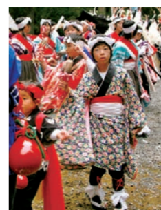
地域のまつりなどで青笹しし踊りを継続している

青笹小PTAは長年にわたり地域教育協議会や地区学校保健会など地域と連携し、六角牛登山や校舎周辺の花壇整備・清掃など健全育成活動に取り組むとともに、郷土芸能である青笹しし踊りの伝承活動など多分野に尽力したことが評価されました。