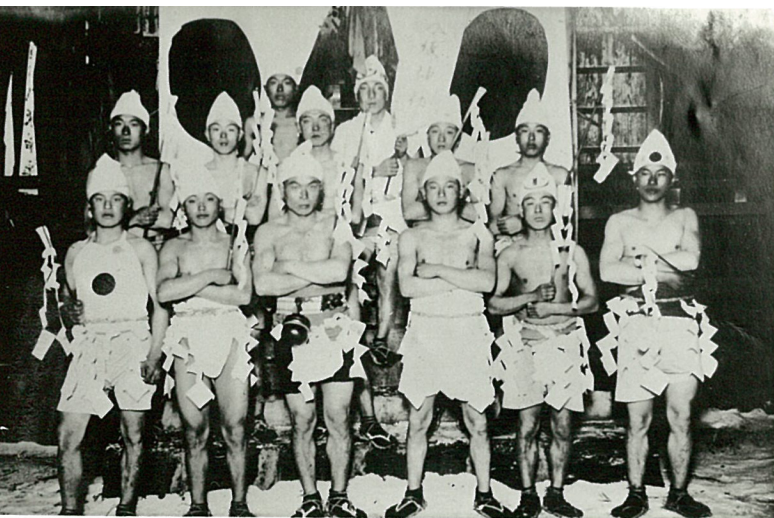
▲裸参りの様子。見物人も多く、出店が出て賑わった。 ▼昭和10年代の様子。幣束を手にしている。