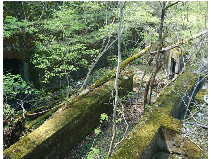
▲発電所跡のコンクリート製の構造物

*カーバイド carbide …炭化物の総称。特に炭化カルシウム(calcium carbide)の略称として用いられる。カーバイトとも。