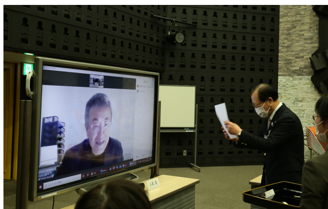
▲オンラインでの辞令交付