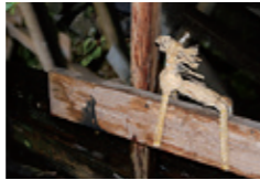
馬っこつなぎ (集落では現在は行われていない)