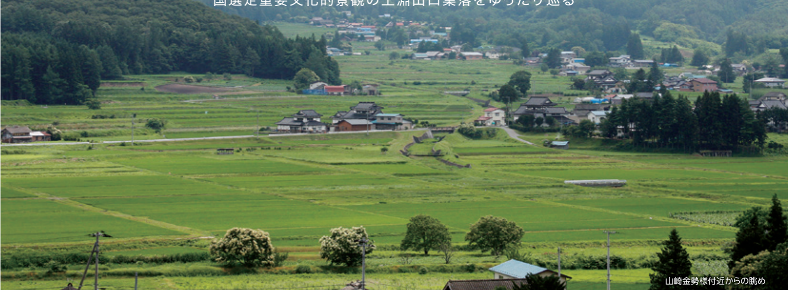
山崎金勢様付近からの眺め