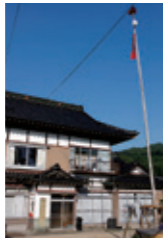
トウロウギ 新しいホトケのある家で新盆から3年間、8/7～8/30までホトケが家に帰る目印として庭先に立てる。