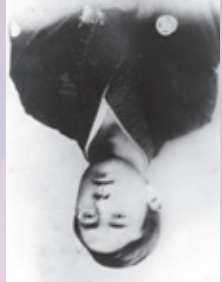
佐々木喜善(鏡石)(1886-1933) 柳田國男の『遠野物語』の読者、佐々木喜善(鏡石) 承(内)がある。