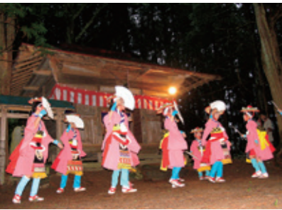
山口さんさ踊り 写真はお薬師様の宵宮にて。

土淵町のなかの小さな集落ですが、『遠野物語』に描かれた時代から脈々と受け継がれてきたさまざまな伝統行事や郷土芸能があります。