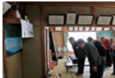
火伏せ 地域で講中を結び古峯神社で授けられた御札を(3月末の自治会総会後に)自治会館の神棚に供え、集落内に火災が起こらないよう、みんなで祈る。