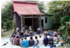
百万遍の数珠回し ダンノハナのオテラッコ前で行われる。