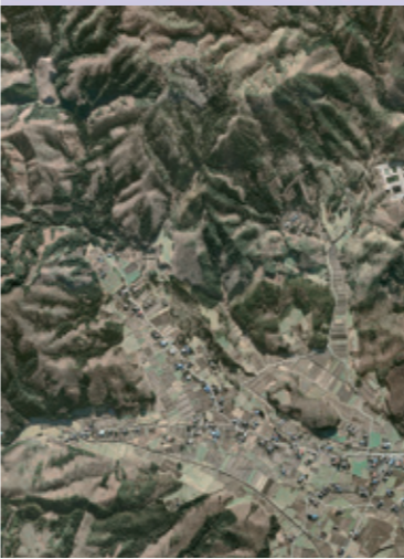
土淵山口集落空撮

遠野市の北東部に位置する遠野市土淵町の一部である山口集落は、長になった時代もありました。山口集落で、彼自身が土淵町の村の代表者として、柳田國男の『遠野物語』の舞台となった「遠野」の代表的な景観地です。『遠野物語』は、佐々木鏡石といふ作家が、そのための物語と、遠野出身の若者の話を、柳田國男からもらってきたのです。鏡石の本名は佐々木喜善。「日本のクノ」と呼ばれる民話作家、柳田國男の『遠野物語』の読者、佐々木喜善(鏡石)(1886-1933) 承(内)がある。