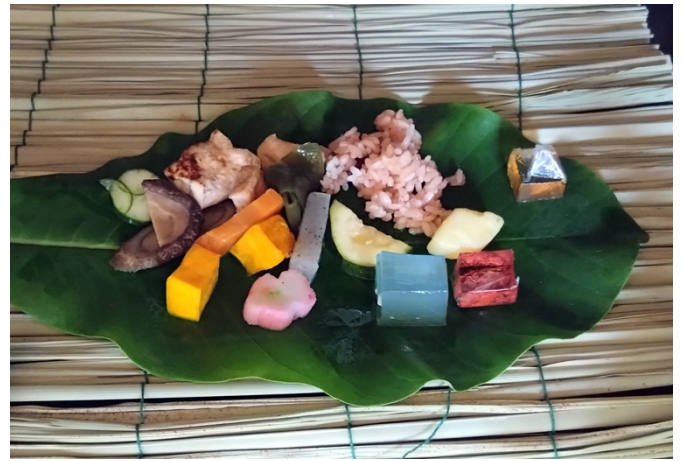
▲お盆に供えられるお膳。各家庭によって異なる。 小友町のK家の場合、ホウノキの葉に赤飯（ふかし）、煮しめ、きゅうりもみ、花麩、菓子などを乗せ、仏壇や墓前に供える。ハスの葉に乗せる場合もある。

ところてんは天草を煮出して抽出した液を冷やし固めたもの、寒天はところてんを凍らせて乾燥させたもの。