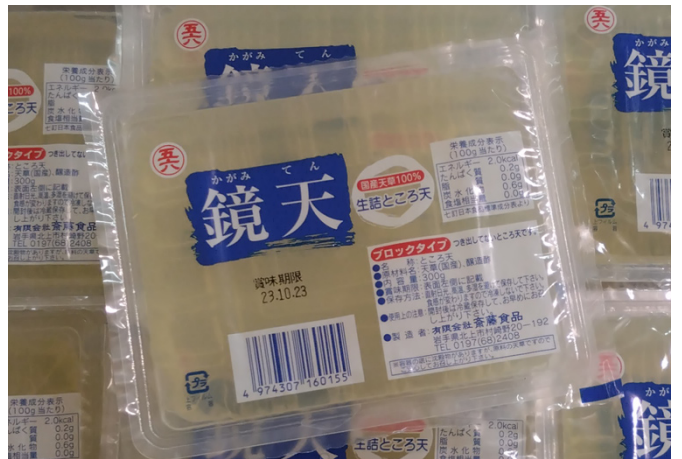
▲市内で売られている鏡天用のところてん

鏡天に関しては、まだ十分な調査が行われていません。皆様のご家庭のお盆は、どんな様子ですか？よろしければ情報をお寄せください。