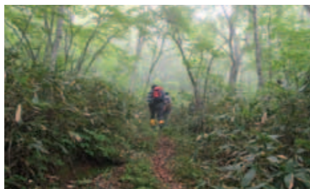
88 早池峰 古の登山道

追分の碑は安永4年(1775)及川善右衛門恒親により旅人のために建立され、道路元標は大正8年(1919)道路法施行令により旧小友村役場前に建てられた。ともに街道の要所であったことを示す遺産である。