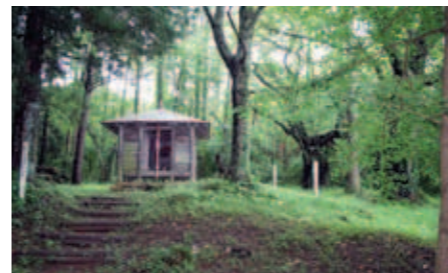
96 横田城跡及び彼岸桜と山桜

ある巫女が婿を疎ましく思い、堰の人柱にしようとしたところ娘まで人柱になり堰に沈んでしまった。悲しんで入水した巫女を祀ったのが母也明神だという。また、近くには巫女、娘、婿の石碑があり、巫女塚として供養されている。