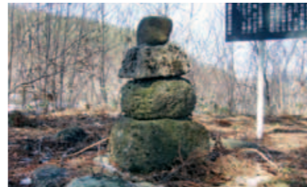
90 砥森神社五輪塔 (本宮五輪塔)

近江弥右衛門は戦国時代末期に遠野へ来て金山開発や佐比内地区の開拓などを行った人物で、伝承によると墓坪かぶをもたらしたという。かつては旧暦3月3日に墓前で祭りが行われていた。