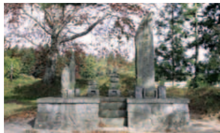
84 阿曾沼公歴代の碑

600年ほど前、京都の八坂神社の神霊を勧請して祀ったのが始まりとされる。その後篤く崇敬を集め、地域の人々に「天王様」と親しまれている。祭神は素戔鳴尊、牛頭天王。