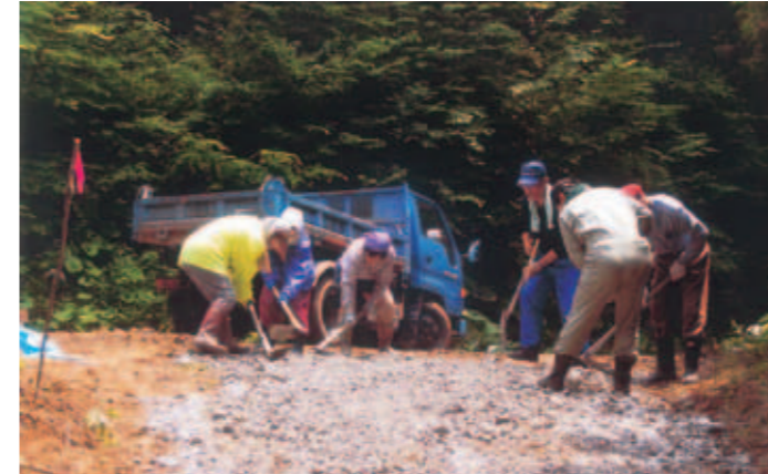
砂利をしいて参道を整備

屋根は全体的に改修を行い、その資材を運ぶために作った道路を参道として整備。訪れる人にも、守り伝える地元の人にも優しい遺産になりました。