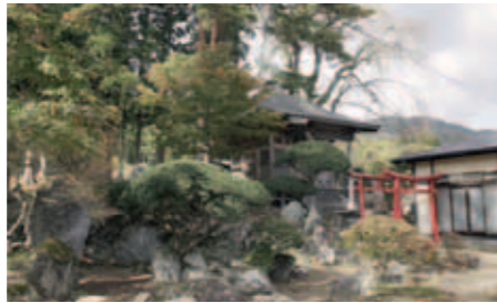
82 村兵稲荷神社 (金ヶ澤稲荷神社)

小友町平笹地区に鎮座する神社。集落の守り神、火の神として信仰され、かつて9月27日の祭礼前日には男性による堂籠りが行われていた。境内には小滝明神、稲荷大明神も祀られている。