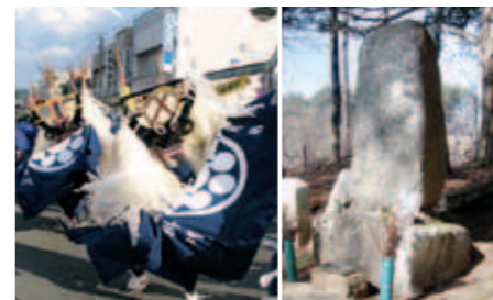
97 駒木鹿子踊りと角助の墓

横田城は阿曾沼広郷が鍋倉山に移るまで阿曾沼氏の居城であった。城内には薬師堂があったが焼失し、現在は小堂が残る。ヒガンザクラとヤマザクラは樹齢およそ300年の古木である。(遠野市指定天然記念物)