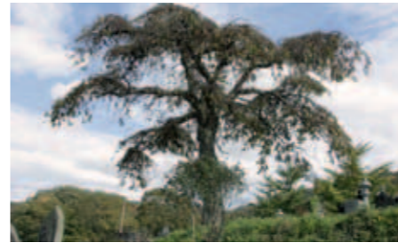
93 長松寺のしだれ栗

目通周囲約7.1m、樹高約30m、樹齢約1500年の巨木である。伐採しようとしたところ出血したとか、オシラサマを根元の洞に入れておいたら一夜で閉じたなど様々な伝説がある。(遠野市指定天然記念物)