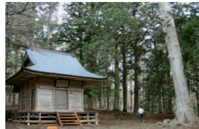
もしご神木が倒れたら、神社にあたってしまいます

そこで、万が一ご神木が倒れてもお社にあたらないよう、土台を修理して後ろに曳き屋することに。ご神木とお社と、どちらも守りたいという地域の方々の思いが実りました。さらに車が通れる道路と駐車場の整備も行い、観光客にも訪れて頂きやすくなりました。遠野物語発刊100周年の年に向け、地域も熱が入ります。