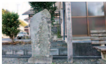
87 小友村道路元標と追分の碑

清心尼は遠野南部家第20代直政の夫人で、夫と嗣子を相次いで亡くしたため第21代を継ぎ清心尼と称した。正保元年(1644)に死去し大慈寺に葬られる。墓石は改葬された際に現在の場所に残されたものという。