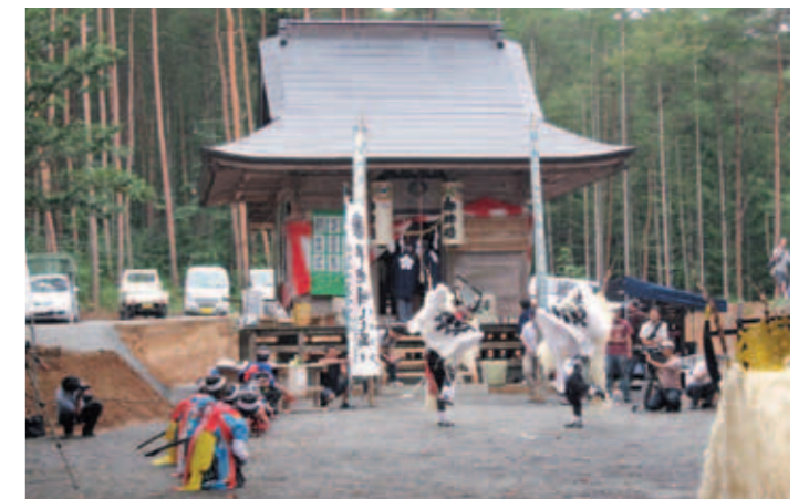
境内が広くなり、例祭も盛り上がります

この他にも石上神社（認定第54号）の改修事業や、青笹八幡宮（認定59号）の境内環境整備などが行われました。