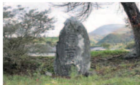
89 近江弥右衛門の墓

遠野から早池峰山への登山道は、早池峯神社に詣で、馬留から横通り、あるいは又一の滝を経由して小田越に至り、そこから山頂を目指した。現在も愛好者などが辿る古の登山道である。