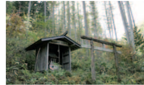
95 母也明神と巫女塚

寛永8年(1631)南部家に帰順した葛西浪士の武器を埋め、その上に社を立てて篠権現と称した。疱瘡除疫神として名高く、参拝者が多かったという。桜は開拓記念に植えられたものと伝わる。