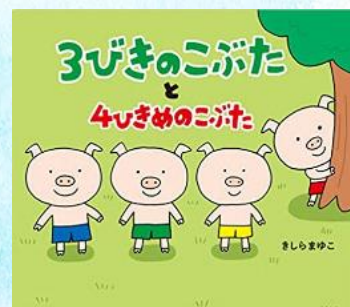
3びきのこぶたと4ひきめのこぶた きしらまゆこ 教育画劇

遠野市わらすっこファミリー・サポート・センターにおける援助活動は、年を追うごとに件数が増えてきています。おねがい会員さんのニーズに合わせ、まかせて会員さん宅等での預かりはもちろん、送迎のみの利用をする方も多く、柔軟に対応できていると感じています。 まかせて会員さんの親切な気持ちによる対応の一つひとつがそれぞれに反映され、おねがい会員さんが「利用してよかった」「助かった」と、ホッとできるような援助活動が展開されています。 保護者の通院や、上の子の行事の他、ゆっくり美容院へ行きたいときやお友達とのランチ等、リフレッシュの際でも利用できますので、お気軽にファミサポまでお問合せください。ファミサポは、子育て家庭を応援しています！