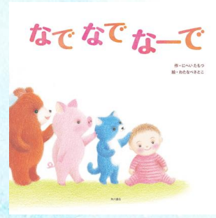
なでなでな〜で にへいたもつ／わたなべさとこ KADOKAWA