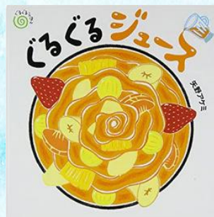
ぐるぐるジュース 矢野アケミ アリス館