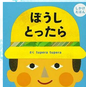
ぼうしとったら Tuperatupera 学研教育出版