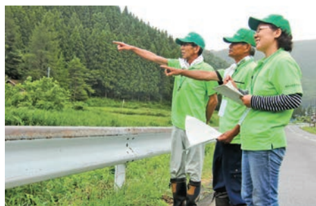
農地パトロールの様子

ル結果は整理され、把握した遊休農地の所有者に対しては、農地の利用意向を調査することになります。