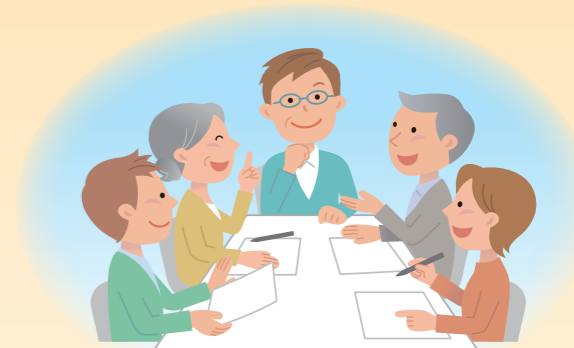
生活課題の解決に向けた支援