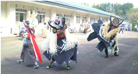
鱒小児童のししと掛け→