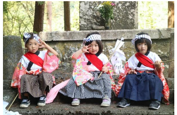
↑花巻から応援に来た「白石神楽」の三つ子ちゃん

祭典の最後には3つの郷土芸能団体で高館八幡神社を巡ったあと、踊りを奉納し、神社内では神事が行われ五穀豊穡と地域の発展を祈願しました。久し振りのお祭りの開催に「白石神楽」、「鱒沢しし踊り」では市外に住んでいる地元出身者が自分の家族を連れての踊り参加や柏木平地区からの参加もあり祭を楽しんでいました。地元では、来年は新しい地区センターを中心とした祭りとして盛大に実施したいと決意も新たにしています。この事業はみんなで作るさと遠野推進事業補助金を活用しています。