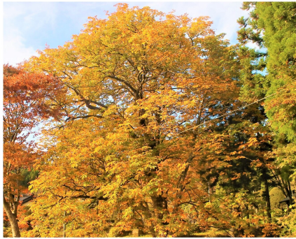
↑ 榎木のトチノキ (写真中央) 10月28日撮影

寺沢川の近くにあり、黄色く葉が色づきます。絵本「モチモチの木」のモデルとなった木が、トチノキとされています。