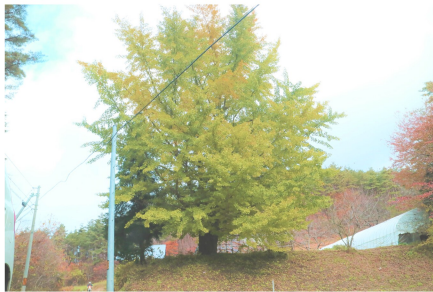
↑ 迷岡の色づき始めたイチヨウ 11月9日撮影

この迷岡のイチヨウは、黄葉するのが遅く、写真を撮った時点では、地域内の他のイチヨウは散っていましたが、まだ緑色が目立ちました。沢山の銀杏がなっていました。