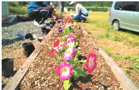
柏木平地区自治会の植栽の様子

中、宮守町の各地域では、感染拡大防止に努めながら出来ることに取り組み、地域の活性化に励んでいます。散歩や車でドライブをしながら、各地域の花壇の花の種類や植え方等の違いを、楽しんでみるのも良いのではないのでしょうか。