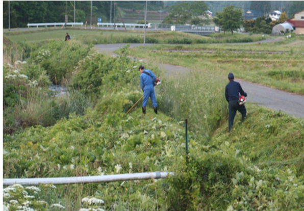
距離を取りながら草刈りを行っている様子