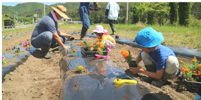
達曽部地域づくり連絡協議会の植栽の様子