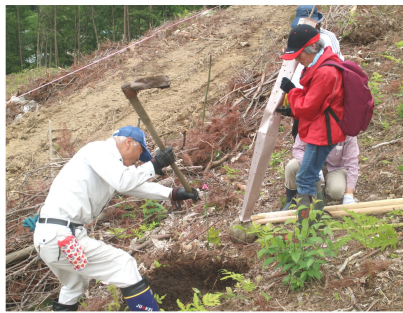
サクラの植樹作業をする様子

6月13日（土）、銀河の森総合運動公園で、遠野市緑化祭「里山フェスタ2020」が開催されました。森林体験活動を通じて森林の役割と大切さを知っていただくとともに、住みよい環境とまちづくりの創造に貢献することを目的に、遠野市が地域の関係機関等と連携して毎年