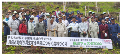
参加者の集合写真

市内の山を会場に開催している行事です。例年は子ども達も植樹に参加していましたが、今年は 新型コロナウイルス感染拡大防止のため、関係機関と関係団体のみで行われ約80名の参加となり、サクラ100本、コナラ、ナナカマド等の広葉樹200本を植樹しました。 今年度の緑化祭の会場が銀河の森に設定された理由の一つに、今年2月に行った宮守町地域づくり推進大会で宮守小学校児童が発表した、地域がもっと明るく楽しい町にしていく取り組みの提案として銀河の森の活用が挙げられ、未来の地域を担う子どもたちの思いを苗木に込めて植えられていました。 また、宮守地域づくり連絡協議会が昨年度から取り組んでいる「銀河の森整備事業」の一環として11名の会員が参加し、慣れない斜面に苦戦しながらも植樹に励み、心地良い汗を流していました。