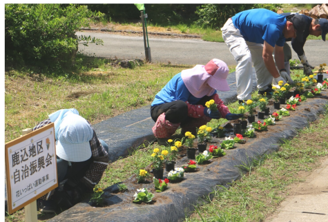
鹿込地区自治振興会の植栽の様子