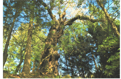
撮影日：4月28日（火）写真中央 上宮守の町裏にある八坂神社そばのエドヒガンザクラ。推定樹齢は、470年。遠野市の天然記念物となっております。

【達曽部地区】 達曽部の米田にある熊野神社境内にあるエドヒガンザクラ。推定樹齢は、170年。 米田の熊野神社と御神木は遠野遺産に登録されており、境内には、樹齢500年の御神木があります。