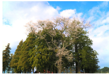
撮影日：4月28日（火）写真中央

鱒沢四社・高館八幡神社とエドヒガンザクラとして遠野遺産にも登録されています。境内は、エドヒガンザクラ以外にも桜が咲いており、とても華やかでした。