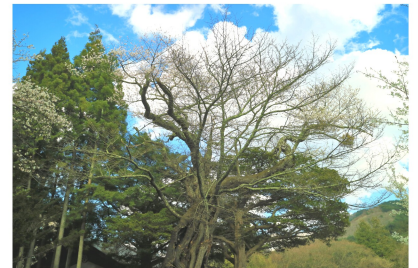
撮影日：4月27日（月）写真中央