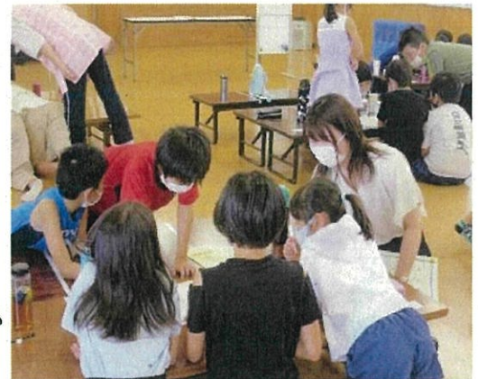
令和3年八幡平市大更第二学童保育クラブの様