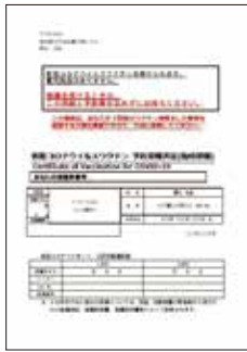
① 案内文書兼接種履歴確認書