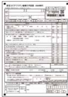
② 接種券一体型予診票 ※あらかじめ記入しておいてください。