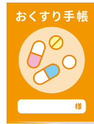
④ お薬手帳 (お持ちの方)