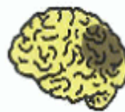
血管が詰まって一部の細胞が死ぬ(脳血管性認知症)