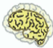
脳の細胞がびまん性に死んで脳が萎縮する(アルツハイマー病などの変性疾患)