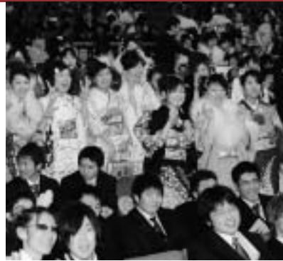
再会を喜ぶ参加者(昨年度の成人式から)