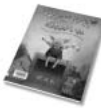
『ゆうびんやさんおねがいね』 サンドラ・ホーニング 著 (徳間書店)

もうすぐ、とおいにすんでいるおばあちゃんのだんじょうび。おばあちゃんがぜったいによるこぶプレゼントを、おもいついたコブタくんは、ゆうびんきよくにでかけました。さあ、コブタくんのとおきのおきのプレゼントをはこぶ、ゆうびんリレーのはじまりです。