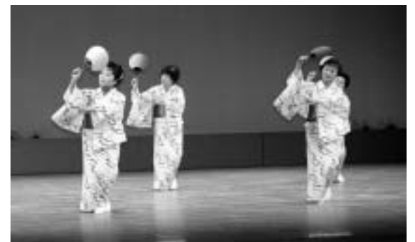
踊りを披露する老人クラブ会員の皆さん(昨年度の文化祭より)

します。芸術の秋、文化の秋と一緒に楽しみませんか。皆さまのお越しをお待ちします。