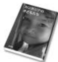
『カンボジアの子どもたち』 遠藤俊介 著 (連合出版)

1999年7月以来カンボジアを訪ねて写真を撮り続けた著者が、特に思い出に残る子どもたちの姿を集めた写真集。長年内戦に苦しんだ国だが、子どもたちの笑顔が実にまぶしい。そして、撮る側、撮られる側に確かなコミュニケーションがあり、作品に温かさを与えている。