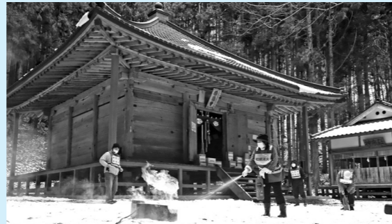
1月28日に宮守町鱒沢で実施した文化財を守る消火訓練。地域の大切な宝を火災から守りましょう