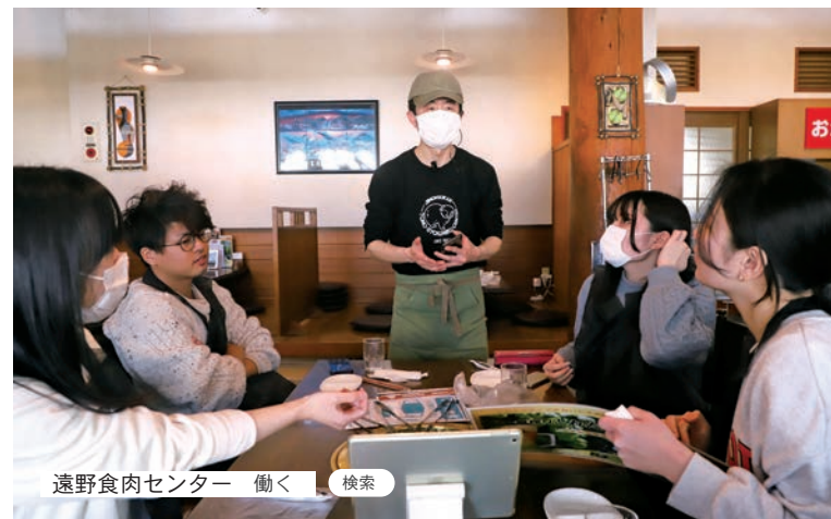
遠野食肉センター 働く 検索