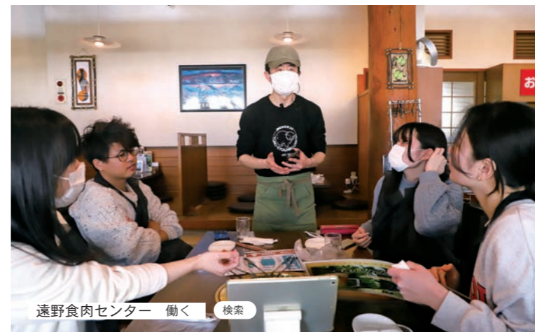
遠野食肉センター 働く 検索