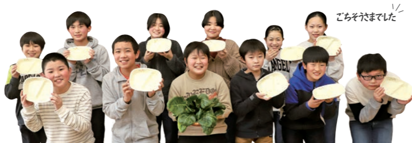
ごそそまでました