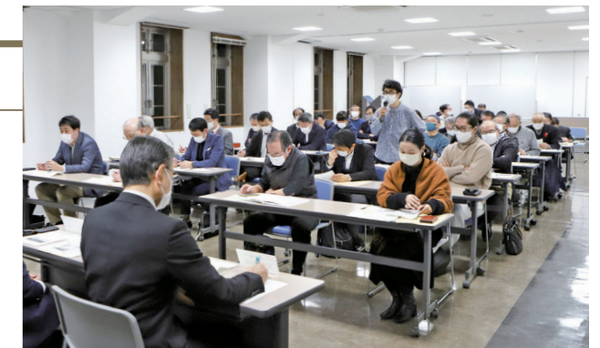
さまざまな意見が交わされました

約2年半ぶりの開催となる同考える会はあすもあ遠野で開かれ、地元団体や企業の代表者ら約40人が参加しました。これまで検討してきた複数の案について、施設概要や事業費・事業期間の試算を市担当者が説明。その後、参加者は駅舎の保存や改築について意見交換しました。今後は、中心市街地活性化協議会への説明会を行い、市民の意見を踏まえてJRと協議を行う予定です。