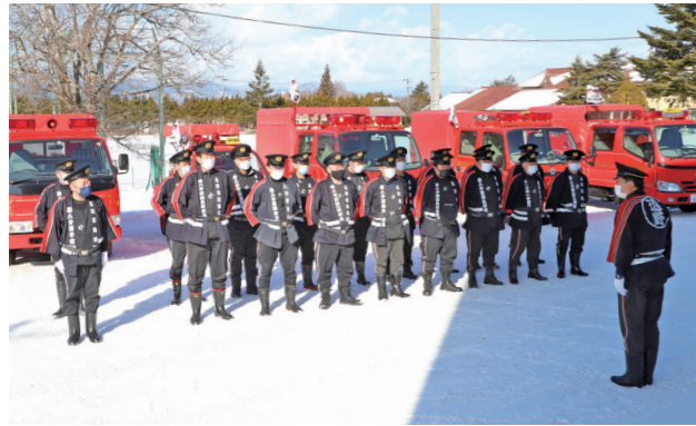
地区センターで出初式に参加した第8分団(上郷町)の団員