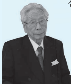
令和2年度高齢者叙勲