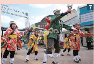
1_風の丘外観 2_改装された物産品展示ホール 3_遠野の景色を眺めながらジンギスカンなどを楽しめる展望デッキ 4_開放的で遠野の味力満載のフードホール 5_市内直送の農産物も大人気 6_遠野緑峰高生会チャレンジショップ 7_綾織しし踊りが舞で祝福