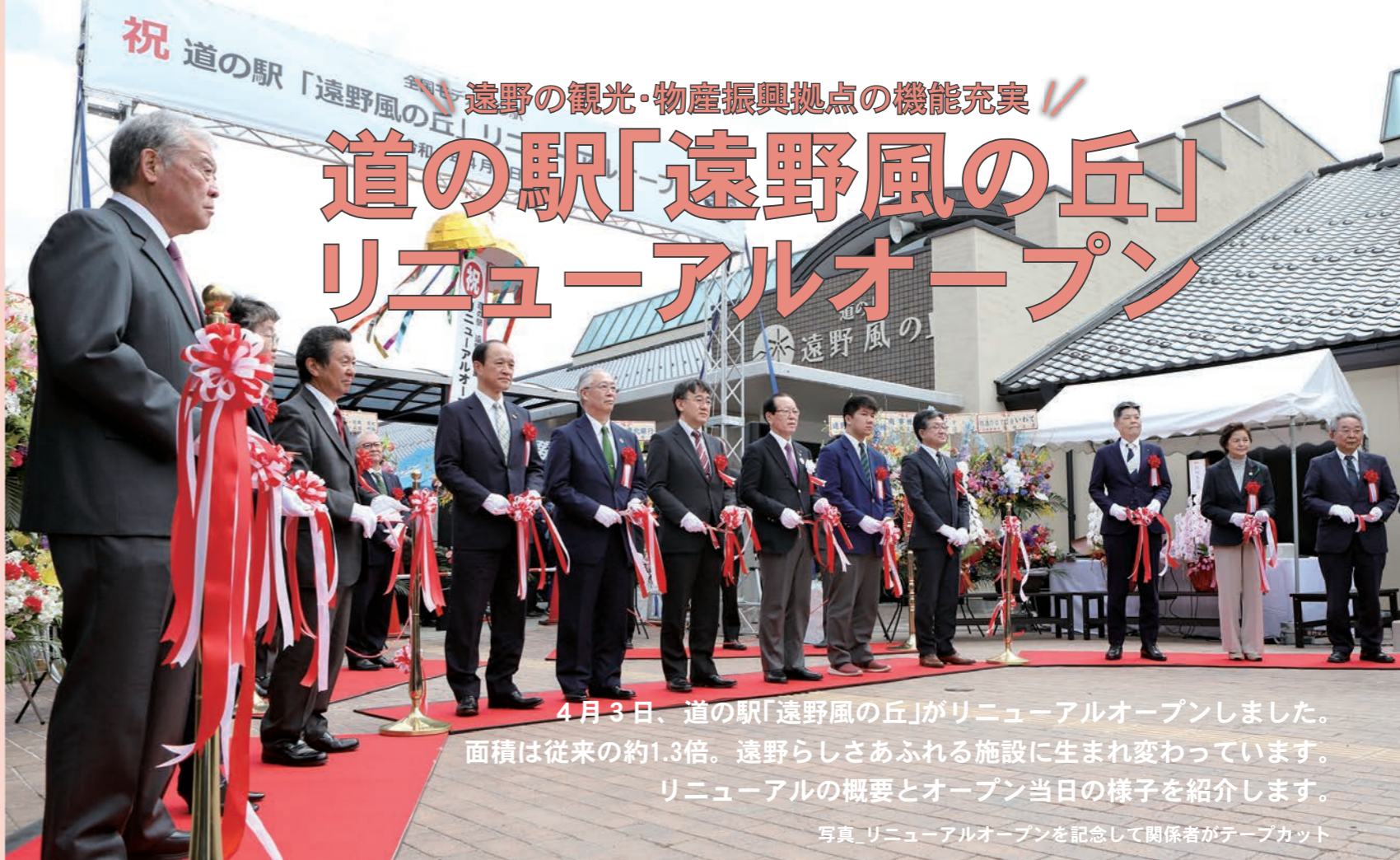
4月3日、道の駅「遠野風の丘」がリニューアルオープンしました。面積は従来の約1.3倍。遠野らしさあふれる施設に生まれ変わっています。リニューアルの概要とオープン当日の様子を紹介します。