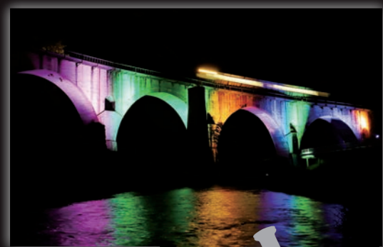
列車が通過するめがね橋

日本夜景遺産…美しい夜景が地域の観光資源として活用され、地域の活性化につながることを願い2004年に発足。全国で261カ所が認定(7月22日現在)。