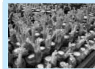
「タラの芽のふかし栽培」は、手間が少なく始めやすいと好評

産者グループで共同飼養する「里山簡易放牧場」モデル事業の導入希望も受け付けています。 ■耕種分野への取り組み 農業経営者の収入安定化を目指す、カット用野菜などの契約栽培を推進しています。 また、労働力の効率化を図るため、ミニパッケージセンターや集荷代行を試行する予定です。品目別には、例えばピーマンのトンネル栽培を拡大する場合や、キュウリの栽培拡大に取り組みむ場合には、市の補助事業も活用できます。この事業は新規生産者も対象としています。 生産についても、遠野農業改良普及センターと連携し、技術的な支援を行います。