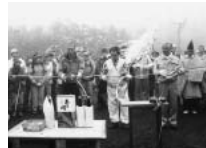
登山シーズンの幕開けを祝い小田越登山口でテープカットする関係者(昨年の山開きより)