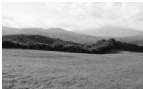
里山遊休地での低コスト共同飼養の実現が期待される

遠野農業のあるべき姿を描きたいわゆる「100億プラン」の実施計画「アストチャレンジ100」を軸に、生産者の「こうしたい」に応える各種取り組みが始まりました。 ■アストチャレンジ100の3つの柱 ①重点品目に目標値と具体策 ピーマンやトルコギキョウなど、特に利益率の高い重点品目の販売を促進し、新品種や出荷時期をずらす新作型への移行を支援しています。 ②元気な農家を育成・支援 積極的な手取り増・規模拡大へのチャレンジ、各種コストの低減化を支援しています。 ③多様な販路の確保 消費者ニーズに対応した商品開発、契約栽培などの多様な販路開拓などに取り組んでいます。