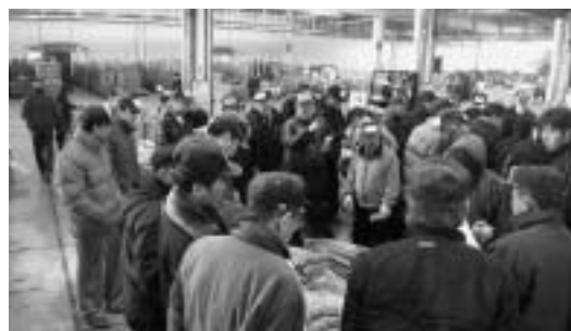
市場ニーズに素早く対応する産地体制を

遠野農業のあるべき姿を描きたいわゆる「100億プラン」の実施計画「アストチャレンジ100」を軸に、生産者の「こうしたい」に応える各種取り組みが始まりました。 ■アストチャレンジ100の3つの柱 ①重点品目に目標値と具体策 ピーマンやトルコギキョウなど、特に利益率の高い重点品目の販売を促進し、新品種や出荷時期をずらす新作型への移行を支援しています。 ②元気な農家を育成・支援 積極的な手取り増・規模拡大へのチャレンジ、各種コストの低減化を支援しています。 ③多様な販路の確保 消費者ニーズに対応した商品開発、契約栽培などの多様な販路開拓などに取り組んでいます。