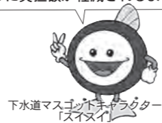
下水道マスコンボックスラクター「スイスイ」