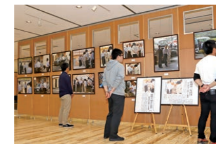
両陛下の写真を見つめる来場者

上皇上皇后両陛下が本市に立ち寄られた際の写真が、市役所本庁舎多目的市民ホールと道の駅遠野風の丘に展示されました。同写真展は、天皇在位30年および御歌碑建立記