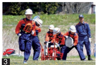
1_統率のとれた分列行進を披露する団員ら 2_消防団の各分団が結集し、放水訓練を披露しました 3_手際よくポンプ操作を披露する宮守小少年消防クラブ員

消防演習は、早瀬川緑地公園などで行われ、団員や婦人消防協力隊員、少年消防クラブ員ら総勢549人と消防車両61台が集結しました。各種訓練では、小隊訓練や放水訓練、ラッパ隊によるドリル演奏などが披露されたほか、宮守小学校少年消防クラブ員の5人が、放課後に練習してきた軽可搬ポンプ操作を披露。参加者は訓練を通じ、防火・防災意識を高め、地域を守る気概を新たにしました。