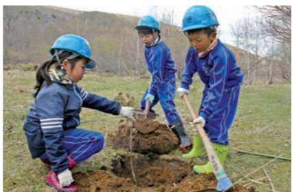
力作もへっちゃら！ 一生懸命な児童

綾織小学校の3・4年生28人は、環境学習の一環として琴畑川上流の国有林地内にミズナラの苗60本を植樹しました。同校の植樹は初で、岩手南部森林管理署遠野支署とN