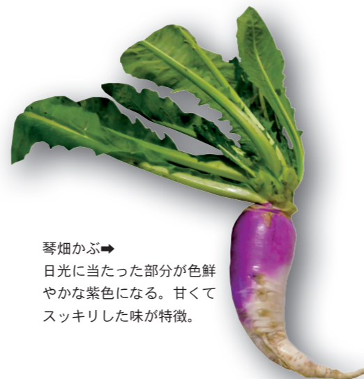
琴畑かぶ→日光に当たった部分が色鮮やかな紫色になる。甘くてスッパリした味が特徴。