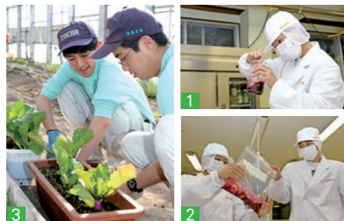
1・2_琴畑かぶの山ブドウ漬は、塩漬けした琴畑かぶを醤油や酢などに漬け、最後に山ぶどうエキスに漬けて出来上がり 3_かぶの生育を見守る生徒