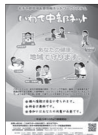
いわて中部ネットポスター