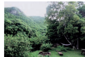
右下のハンモックあたりにカッパがくるといわれています

カ ッパ好きの私が「沖縄にもいるらしいぞ」と言ったのを覚えていた娘が、沖縄で結婚式をしようとってきた。カッパがでると言われている場所も見つけたからと。それで2010年5月、披露宴とは別建ての、親族だけの新婚旅行とカッパ探しを兼ねた結婚式のために沖縄入りした。新郎新婦を含む我が家の一行は12人。3台のレンタカーを借りて目的地の喫茶店に向かう。カーナビはどんどん山の中に連れていく。舗装道も途切れる。1時間以上は走ったが何の気配もない。もう引き返そうと思った時、ついに店が現れた。それぞれがコーヒーなどを注文し、一段落したところでカッパの話を持ち出した。「ええ、あそこのハンモックの脇にちょくちょく来るんです」と事もなげにその女主人は言った。ただし、自分では見たことはない。何人かの客がそういうのだと説明した。聞いてみるとどうやら、カッパとザシキワラシを混ぜたような存在のようだった。そういえば佐々木喜善も「カッパとザシキワラシは同じ」と言っていた。