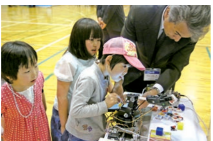
ロボット操作に夢中になっていました

同マルシェは遠野みらい創りカレッジ(旧土淵中)で開催。市民ら800人が鎌倉時代から約400年にわたり開かれていた