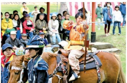
真剣な眼差しで矢を放つ

遠野郷八幡宮の「こども流鏝馬」は同所で開かれ、市内外21人の児童生徒が参加。子どもたちは奉行姿で馬に乗り、