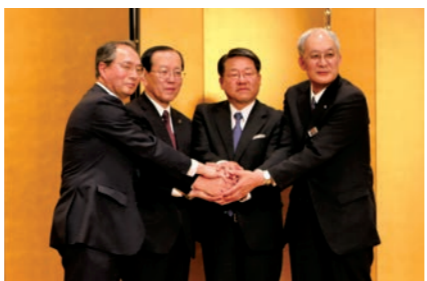
4者が「いわてっこ」の生産支援を誓う

同合意式はあえりあ遠野で行われ、本市と米穀専門卸商社の(株)津田物産(大阪府)、JAいわて花巻、全農いわて