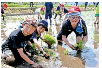
泥の感触を楽しみながら田植えをする児童

青笹町にある上閉伊酒造(株)は、日本酒ができるまでの過程を理解してもらおうと、同社裏の田んぼで田植え体験を開催しました。体験には、青笹小学校の5年生17人が参加。