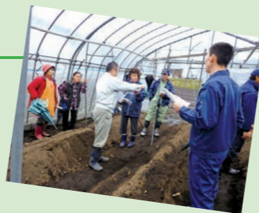
↑昨年開催の説明会