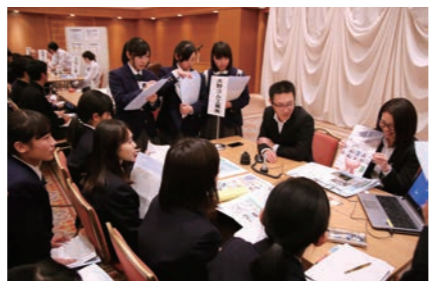
高校生にPRする企業の担当者

市内の高校生に、地元就職について考えてもらうための企業説明会が開催されました。市内の27社が出展し、遠野高校と遠野緑峰高校の2年生180人に、事業概要や求める人材像についてプレゼンしました。市内の事業所で働く両校の卒業生も駆け付け、現役生に地元就職のメリットや楽しさを伝えました。