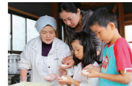
「やきもち」づくりに挑戦する参加者

市総合食育センターは、食育について理解を深める「ばすぼる食育まつり」を同所で開催し、家族連れなど350人が来場しました。郷土料理の体験コーナーや学校給食の試食のほか、鮭の解体ショー、新鮮野菜の販売会など多彩なイベントを実施。来場者は、楽しみながら食の重要性について学びました。