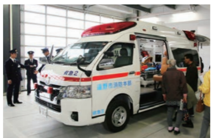
配置された高規格救急車

遠野消防署宮守出張所の高規格救急車が新車両に更新され、配置式が市総合防災センターで行われました。市民ら50人も車両を見学。医師の指示の下で高度な救命処置を可能にする資機材を備えた新車両に期待を寄せました。導入費用は、車両と資機材を合わせて約3,250万円です。