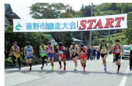
ゴール目指して一斉スタート

市内9地区対抗の継走大会は、旧J A小友支店前から市民センターまでの市内各町を巡る約60*のコースで行われました。チームは、各年代の男女14人で構成。参加した126人は沿道の声援を背に力走し、地域の絆を深めました。 【上位成績】 1位=遠野町(7年連続)、2位=青笹町、3位=宮守町