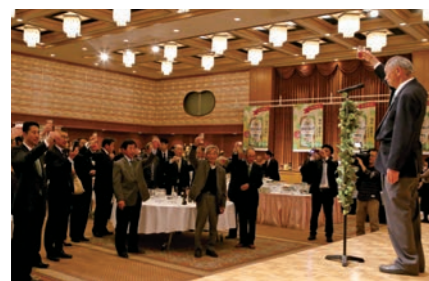
待ちに待った乾杯の瞬間

同会があえりあ遠野で開かれ、市内ホップ農家やキリンビール関係者ら300人が参加。遠野産ホップの爽やかな香りとのど越しを味わいました。2017年産は、雑味と渋味を減らすため低温ろ過技術を採用。例年に増して、ホップの香り引き立つ仕上りになっています。参加者はホップの香りを堪能しました。