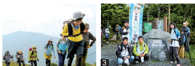
1_頂上では、たくさんの登山客が見守る中、早池峰・岳神楽が舞を奉納 2_美しい高山植物が登山客をお出迎え 3_国体PR隊は旗を持って登りました

遠野三山の一つである早池峰山で山開きが行われ、訪れた多くの登山客は、本格的な登山シーズンの幕開けを祝いました。小田越え登山口で入山式を行った後、参加者は早池峰山の固有種・ハヤチネウスユキソウなどの高山植物を眺めながら、一步一步頂上を目指して歩きました。頂上では、安全祈願祭が行われ、早池峰・岳神楽保存会が権現舞を奉納。山頂にはたくさんの人が詰め掛け、絶景を楽しんでいました。