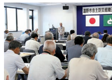
各組織の情報交換が活発に行われました

市内の自主防災組織の代表者59人が出席し、各組織の情報交換などを行い、地域の防災体制の充実強化を図りました。会議では、今年度の事業計画や災害時における指定緊急避難場所の確認などを行ったほか、新たに結成された塚沢・新穀町・鱒沢5区の3自治会へ応急手当セットなどの物品が交付されました。