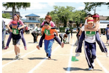
運動会を通じて地域の絆を深めました

市内9町でそれぞれ町民運動会が開催され、合計約5,800人が参加しました。玉入れ、綱引き、リレーなどの競技が繰り広げられると、客席からは大声援が。会場によっては、郷土芸能や消防団の訓練などを披露する所もありました。運動会を通じて世代間の交流を深め、地域の結束を強める一日になりました。