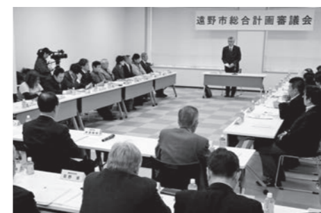
議論を深める市総合計画審議会のメンバーら

総合計画「基本構想」とは 市総合計画は、これからの10年間で市が取り組むまちづくりの指針となるものです。内容は、▽本市が目指す将来像やまちづくりに向けた基本理念を明確にする「基本構想」▽基本構想を実現するために必要となる主要施策を明確にする「基本計画」▽事業内容や実施時期を明確にする「実施計画」の3つからなります。市民ら25人で組織する総合計画審議会と、議会の承認を経て正式に決定されます。第2次総合計画は、平成28年度から平成37年度が計画期間。基本構想は6月市議会定例会で正式に承認されました。基本計画と実施計画は、4〜5月に開催された「市長と語るろう会」で出された「市長と語るろう会」で出された