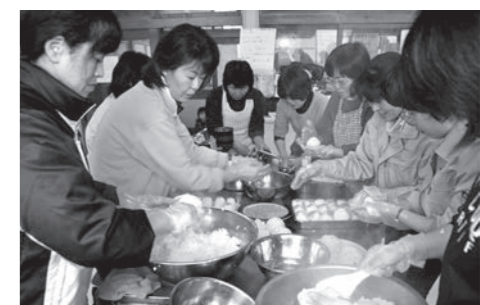
官民が一丸となって取り組んだ沿岸被災地後援活動も「遠野スタイル」の一つ

本市のまちづくりの形である「遠野スタイル」は、市民センターや各地区センターを拠点に、各種団体などによって実践されています。「遠野スタイル」とは、▽地域の特性や資源を活かすこと▽市民が主体性を持つこと▽自分たちのまちをより良くしようと行動すること―を基調に展開するまちづくりのこと。市民と行政の協働活動その