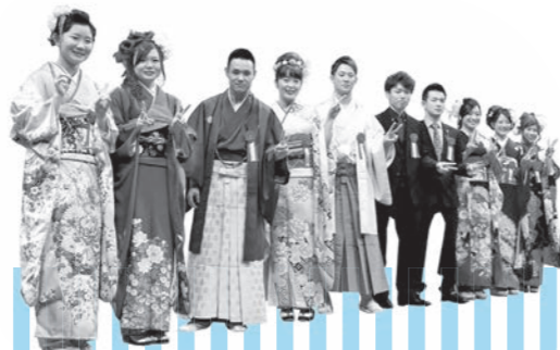
←平成26年度成人式実行委員会の皆さん

来年1月10日に開催を予定している成人式の実行委員を募集します。自分たちの手で思い出に残る成人式をつくり上げてみませんか?▷対象 平成7年4月2日から平成8年4月1日生まれの人▷問い合わせ 市生涯学習スポーツ課 (☎62-4413 内線272)